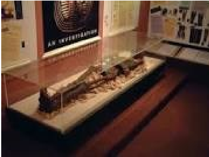
Le pharaon au musée.

mort. Pour eux, après la mort, le roi doit faire un grand voyage, vers le royaume des morts.